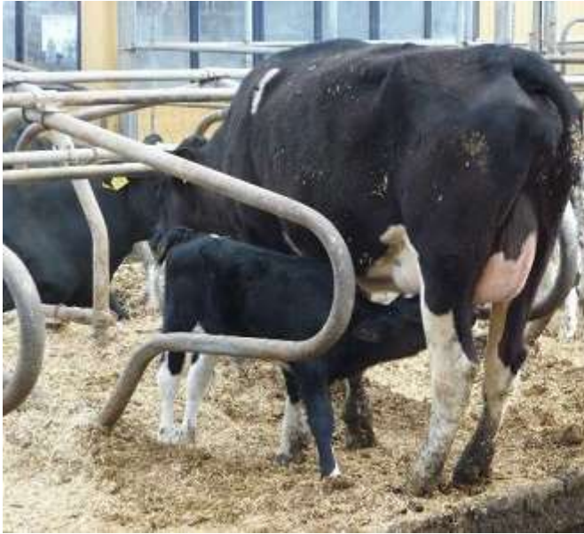
Kalf bij koe in ligboxenstal en