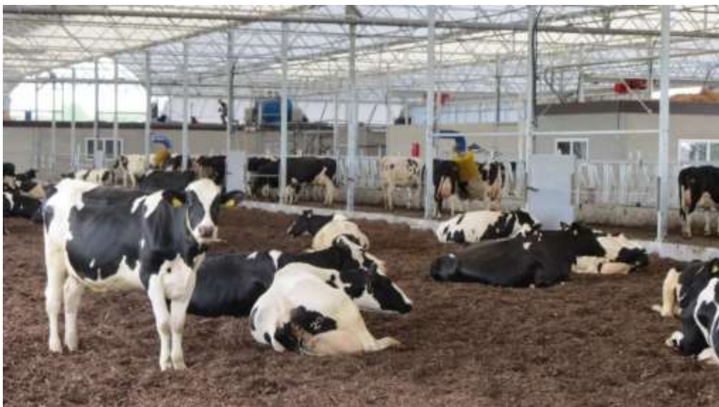
Een vrijloopstal met houtsnippen als bodemmateriaal