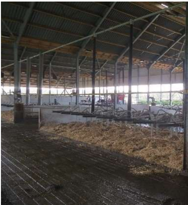
Kwatrijnstal: automatische dosering stro in boxen. Veel ruimte.

Er is veel ruimte voor de dieren, er wordt stapelbare mest geproduceerd, energie komt van zonnedak en er wordt gebruik gemaakt van een mobiel melksysteem om percelen op afstand ook gemakkelijk te kunnen weiden.