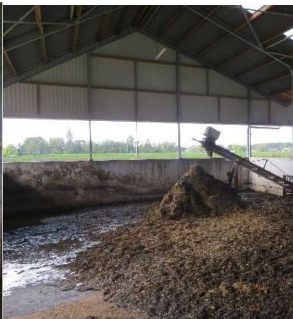
Storrijke mest.